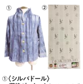
①〈シルバドール〉 藍染ジャケット (フリーサイズ) 66,000円 [現品のみ] ②〈幸陽社〉琉球絣 (絹100%) 198,000円