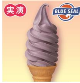
〈ブルーシール〉 紅いもソフトクリーム 481円