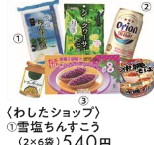
〈わしたショップ〉 ①雪塩ちんすこう (2×6袋) 540円 ②オリオンドラフト (350mL、アルコール5%) 363円 ③紅いもタルト (6個入) 1,425円