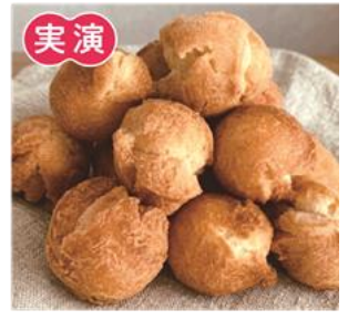
〈カフェ34〉 サーターアンダギー (1個) 220円