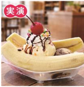
〈ブルーシール〉 バナナスプリット (1皿) 1,001円

沖縄の豊かな食文化と特産品を一堂に集め、現地を訪れたかのような " 旅気分 " を味わえるイベントです。