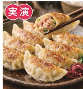
〈YKB〉 アゲー餃子 (1パック) 1,117円