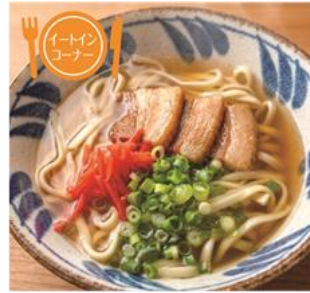
〈大麦の番人〉 島豚の沖縄そば (1杯) 1,320円